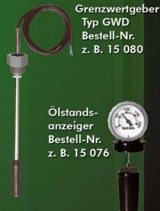
Grenzwertgeber Typ GWD Bestell-Nr. z. B. 15 080

Der sensorischen Prüfung wurden gleich vier Produkte unterworfen: