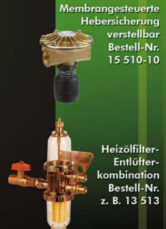
Membrangesteuerte Hebersicherung verstellbar Bestell-Nr. 15 510-10